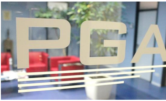
Foyer & Empfangsbereich der PGA